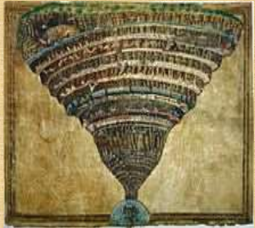
Тамұқ. Сандро Боттичели

«Әлемді жаратушы – жалғыз Құдай, ал Құдайдың ең ғажайып жаратындысы – адам» деген негізгі идеяны қазық еткен бұл шығарма Қайта өрлеу кезеңінің антропоцентризмінің алғашқы туындысы болып табылады.